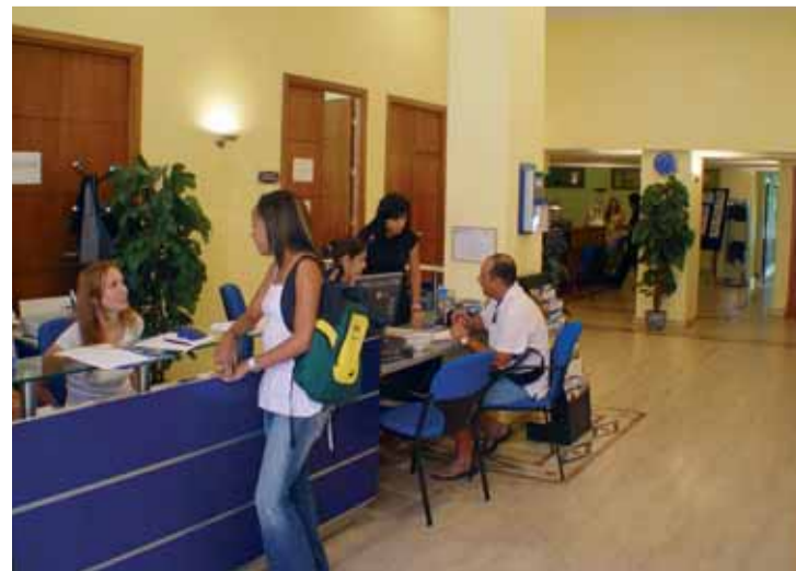
Recepción de Enforex Madrid

El horario habitual de las tiendas en Madrid es de las 9:00 a las 20:00 h., aunque cada vez son más los comercios que permanecen abiertos a mediodía y hasta las 22:00.